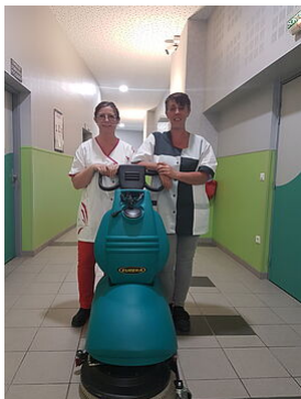
Une autolaveuse au Collège Buvignier à Verdun (juillet 2019)

Les 155 agents départementaux des collèges sont en charge au quotidien de 3 types de missions au sein des établissements scolaires: