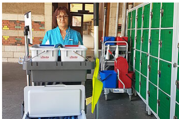
Agent des collèges