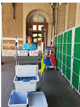
Chariot d'entretien des agents de propreté